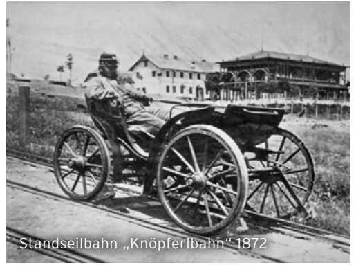
Standseilbahn „Knöpferlbahn“ 1872