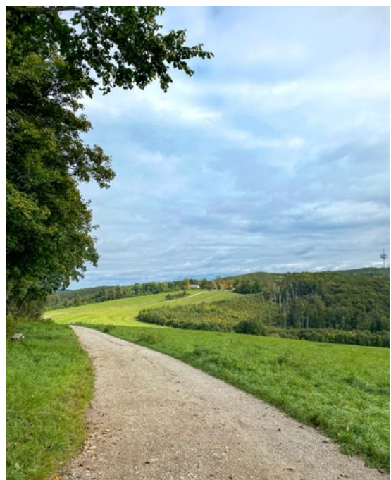
Stadtwanderweg 8 in Richtung Sophienalpe