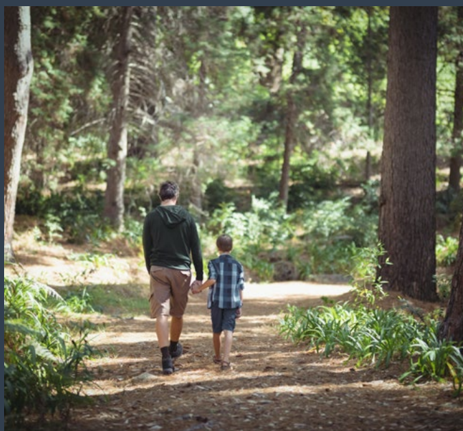
Wanderungen mit der ganzen Familie