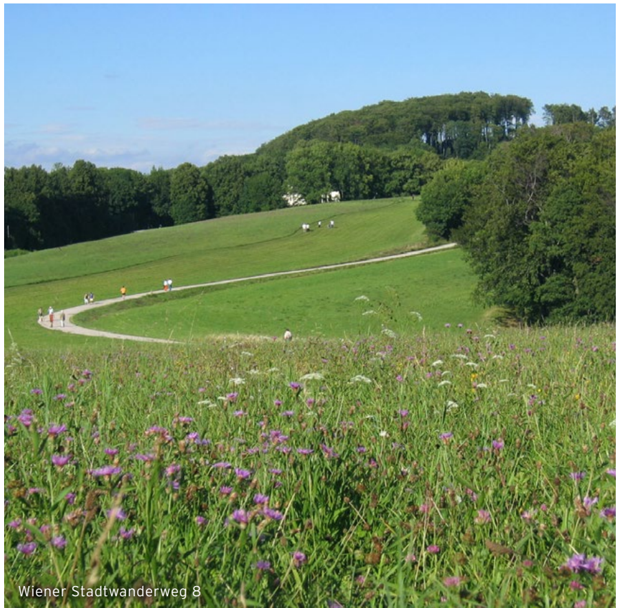
Wiener Stadtwanderweg 8