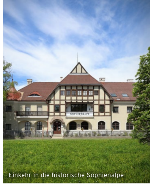
Einkehr in die historische Sophienalpe